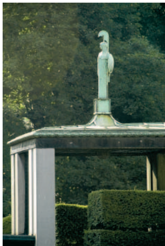
© SYLVAIN PIRAUX ET DOMINIQUE RODENBACH