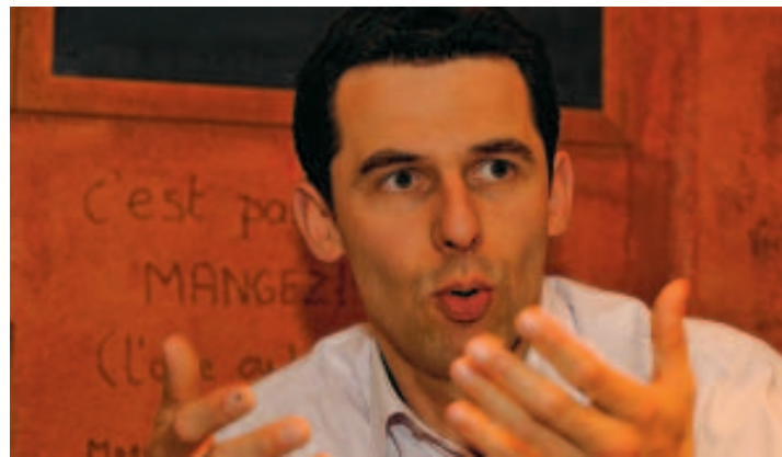
JEAN-MARC Nollet est, avec Rudy Demotte et Jean-Claude Marcourt, un poids lourd au sein du gouvernement wallon.

Les compétences de l'Ecolo Jean-Marc Nollet au sein de l'exécutif de la Région wallonne et de la Communauté française sont innombrables. Mais le chef de file des verts au sein de ces gouvernements déborde d'enthousiasme. Sa priorité va à l'alliance emploi-environnement. Qui, c'est une promesse, aura rapidement des accents concrets pour les citoyens wallons. Le Hennuyer loue déjà son entente avec le ministre wallon de l'Economie, Jean-Claude Marcourt. ■