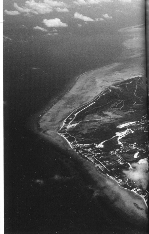
Steuerparadies Cayman-Inseln: Anonymisierte

Elmers Sammlung betrifft unzählige Kunden, die ihr Geld an einem höchst verschwiegenen Platz geparkt haben: auf den Cayman-Inseln, einer 300 Kilometer südlich von Kuba gelegenen Gruppe von drei